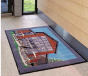
Luo hyvä ensivaikutelma.