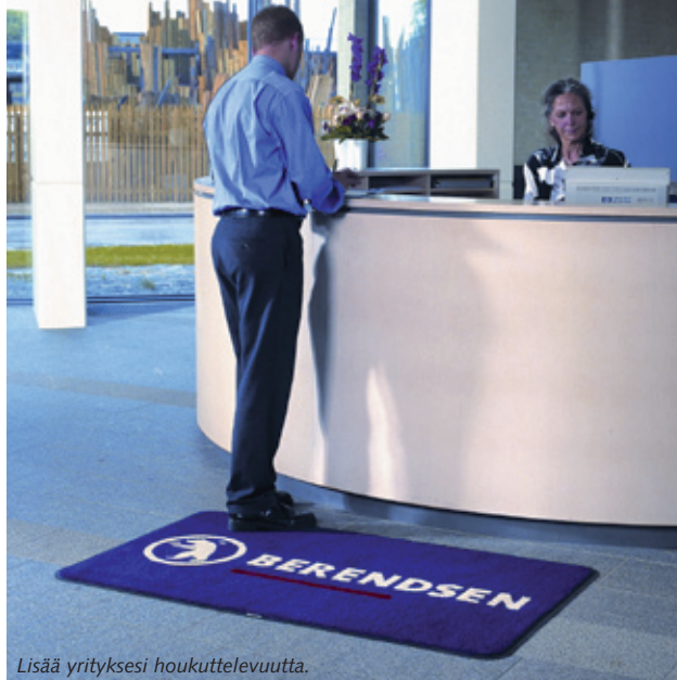
Lisää yrityksesi houkuttelevuutta.