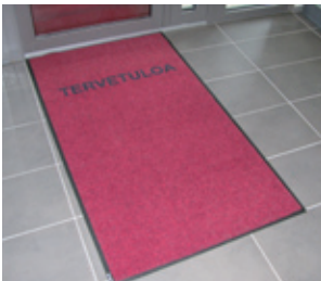
Suunnittele haluamasi logomatto.